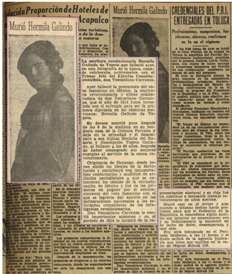
La prensa reportó: "la escritora revolucionaria y precursora del voto femenino en México murió después de las 6 de la mañana en su casa ubicada en la colonia Portales de la Ciudad de México."

murió el 19 de agosto de 1954 acompañada de su fiel e incansable máquina de escribir, en cuyo rodillo quedaron las últimas páginas en las que reflexionaba sobre los problemas nacionales y la urgencia de que la sociedad mexicana fuera más justa.