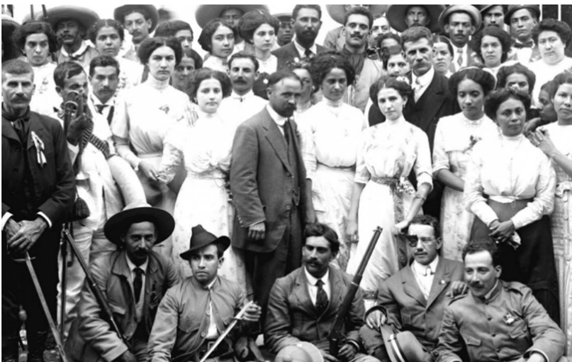
Desde el inicio de la lucha maderista, contingentes de mujeres se unieron en torno a la causa antirreeleccionista.